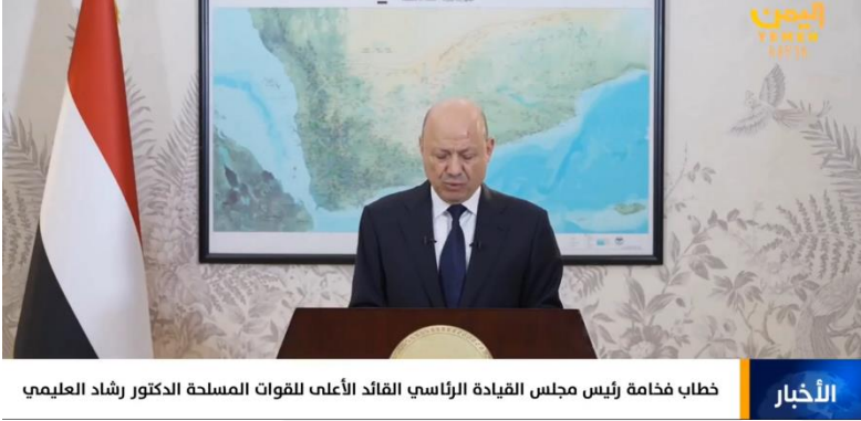
خطاب فخامة رئيس مجلس القيادة الرئاسي القائد الأعلى للقوات المسلحة الدكتور رشاد العليمي

ومع استمرار تعنت الحزب الانتقالي وعدم استجابته لجهود المملكة العربية السعودية، خرج الرئيس اليمني رشاد العليمي عبر قناة اليمن الرسمية ليؤكد أن توجيهاته بمنع أي تحركات عسكرية قوبلت بالرفض من الحزب الانتقالي: